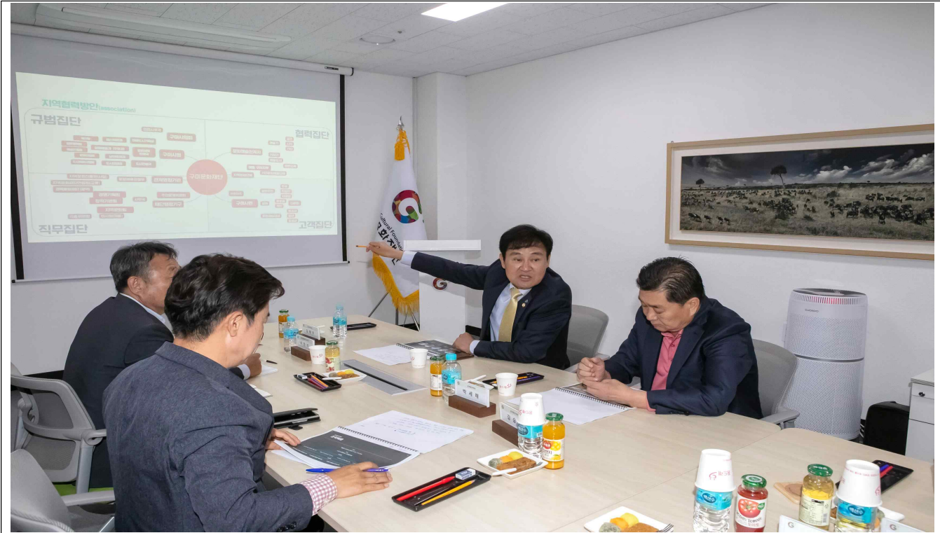
구미문화재단 현황 청취