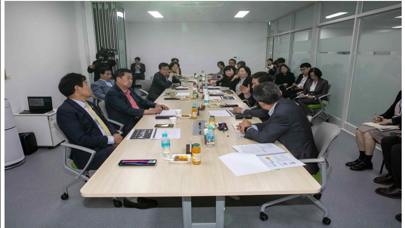
구미문화재단 현황 청취